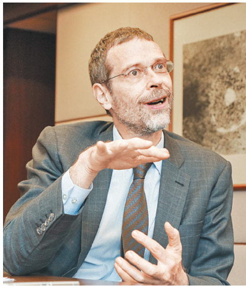
裴克為指本港有豐富經驗的人手和配套去籌劃大型展覽活動。