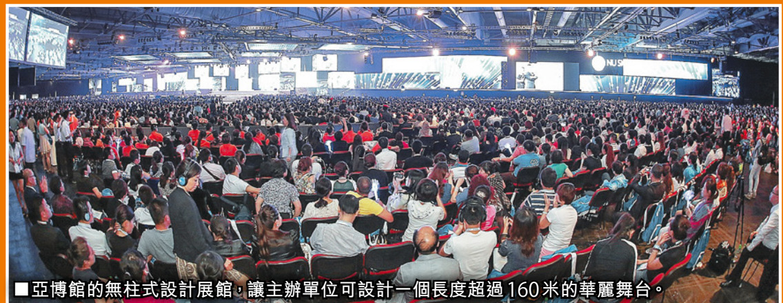
亞博館的無柱式設計展館，讓主辦單位可設計一個長度超過160米的華麗舞台。

這次活動更印證亞博館處理大型餐飲安排的能力，除成功配合緊密的會議流程、於同日午、晚膳時間分發3.8萬份餐點，更可保持食物水準，亦同時與活動的主辦機構合作宣揚食物回收的概念。